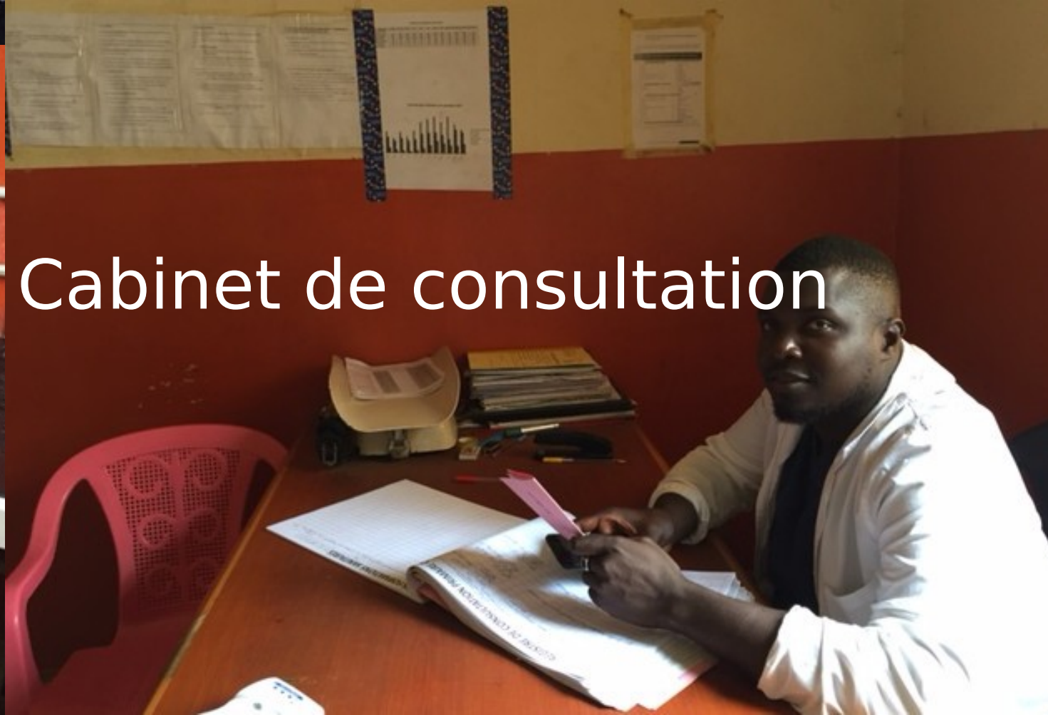
Cabinet de consultation