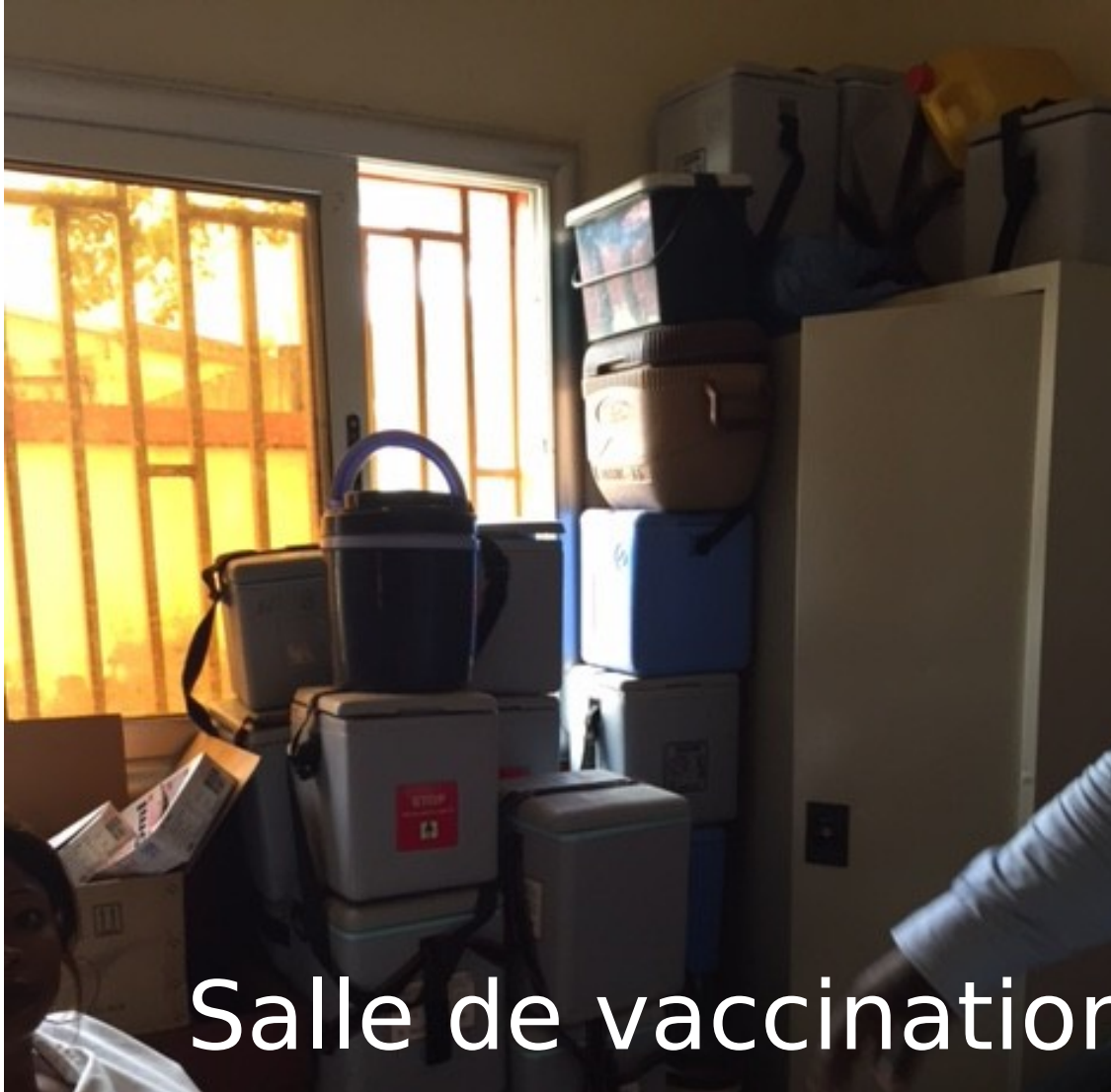
Salle de vaccination